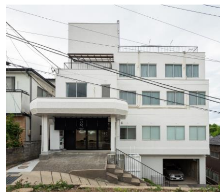
シェアハウス180° 金沢

※売買も検討させていただきます。 ※上記以外のエリアにつきましても、積極的に検討させていただきます。 些細なことでも結構ですので、お問合せ頂けましたら幸いです。